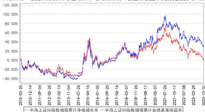
中海上证 50 指数增强累计净值增长率与同期业绩比较基准收益率的历史走势对比图