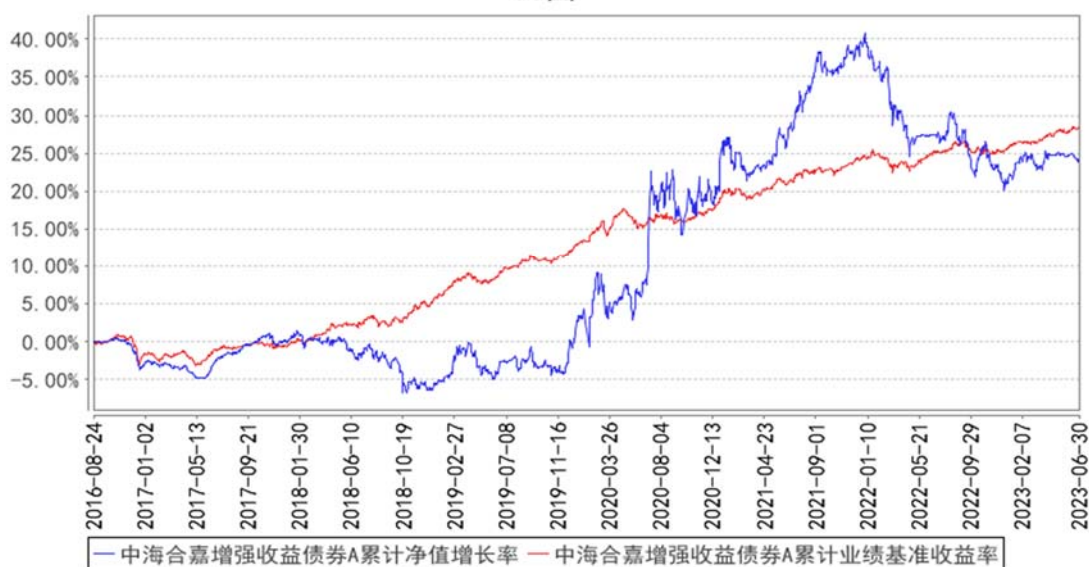
中海合嘉增强收益债券A累计净值增长率与同期业绩比较基准收益率的历史走势对比图